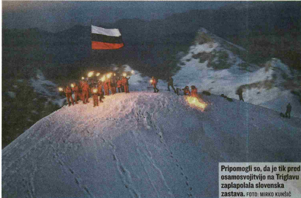
Pripomogli so, da je tik pred osamosvojitvijo na Triglavu zaplapolala slovenska zastava.